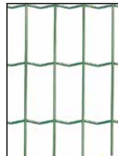
BOUCLIER MAILLE 100*50, FIL 3.0MM VERT