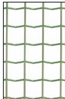
FORTYROL MAILLE 50*50, FIL 3.0MM VERT